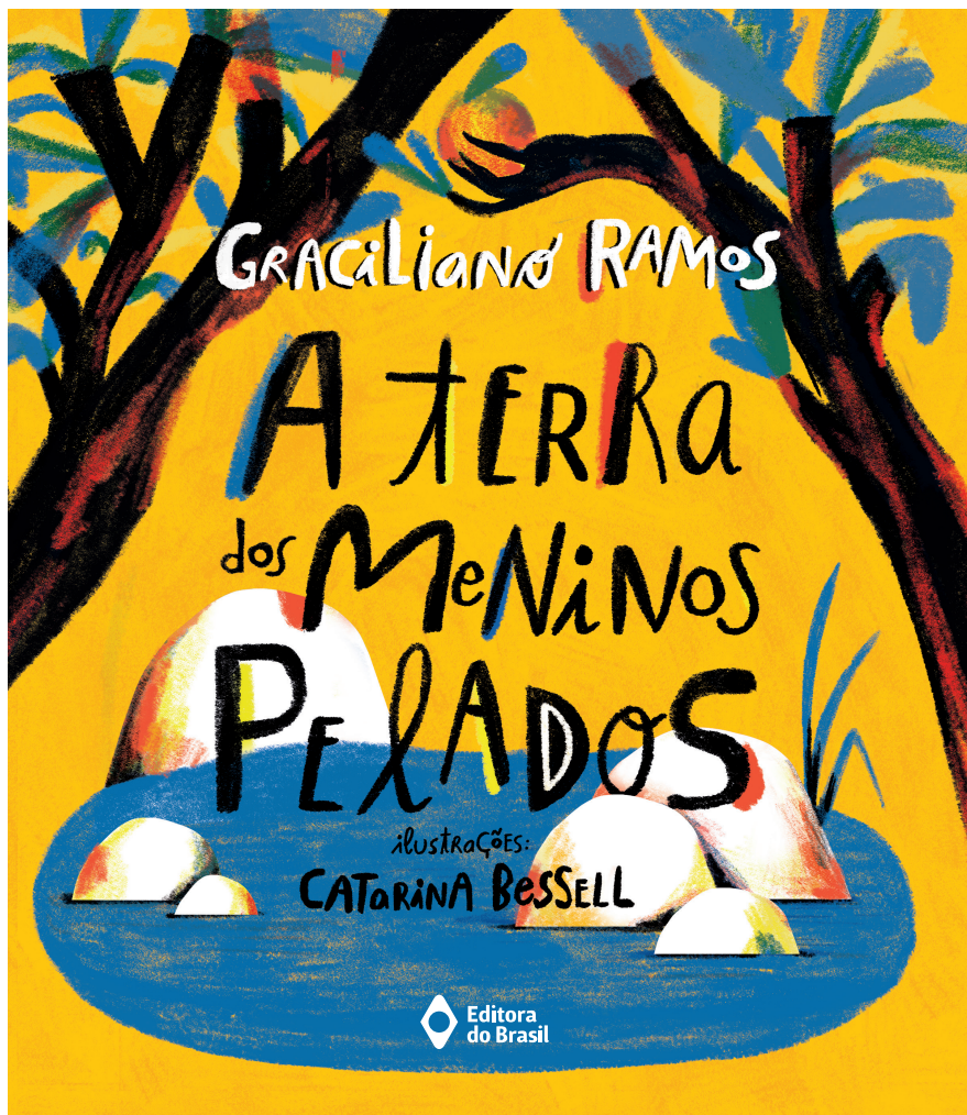
Graciliano Ramos Ilustrações de Catarina Bessell