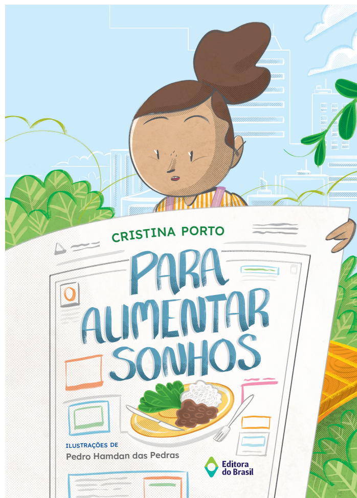
Cristina Porto Ilustrações de Pedro Hamdan das Pedras